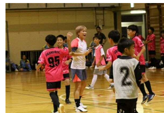
(サッカー教室の様子)