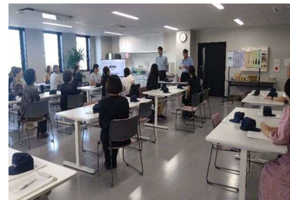
9/10 アネックスツール(株) 様