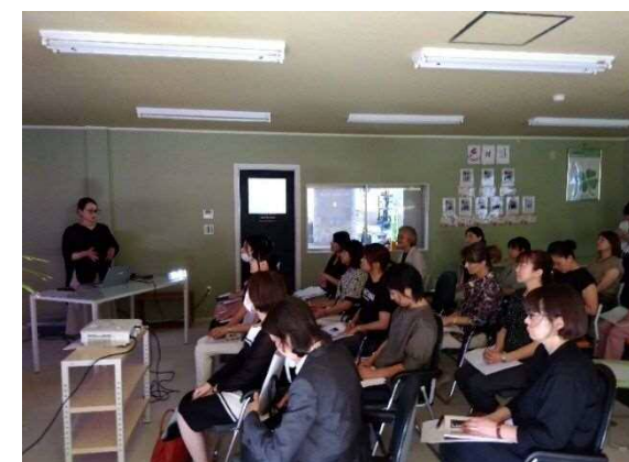
9/10 (有)栄工業 様